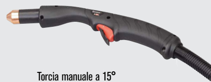
Torcia manuale a 15°