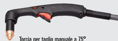
Torcia per taglio manuale a 75°

(per un numero maggiore di opzioni di torcia, consultare il sito Web www.hypertherm.com )